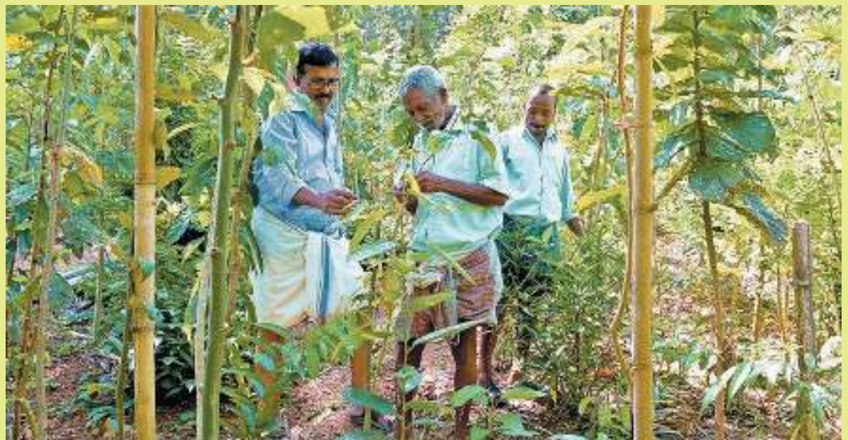
ഡോ. അകീരാ മിയാവാക്കി

ശാസ്ത്രത്തിനും സാങ്കേതികവിദ്യയ്ക്കും നൽകുന്ന അത്രതന്നെ ആദരം പ്രകൃതിയോടും, സംസ്കാരത്തോടും, സഹജീവികളോടും ഉണ്ടാകണം. മനുഷ്യത്വത്തിന് പകരം നിൽക്കാൻ മറ്റൊന്നുമില്ല. ഇന്ന് നമ്മൾ നേരിട്ടുകൊണ്ടിരിക്കുന്ന പ്രകൃതിദുരന്തങ്ങൾ നമ്മെ പഠിപ്പിക്കുന്ന പാഠം ഇതാണ്. പഴയ സാമൂഹിക പാഠങ്ങൾ മാറ്റപ്പെടുത്താതെ ഇനിയുള്ള കാലത്തുജീവിതം സാധ്യമല്ല എന്ന പാഠം 'കോവിഡ്' നമുക്ക് കാണിച്ചുതന്നില്ലേ. പുതിയപാഠങ്ങൾ അനിവാര്യമാണ്. കാലം അതാവശ്യപ്പെടുന്നു. •